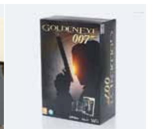
Гофрокартон с печатью