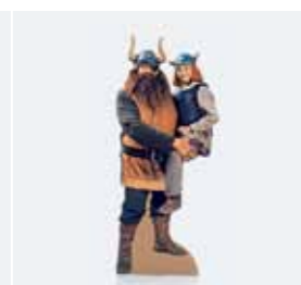
Дисплей из вспененных панелей