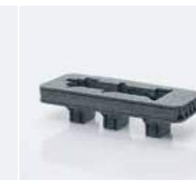
Ложементы из вспененных материалов