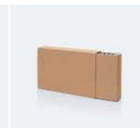
Гофрокартон без печати