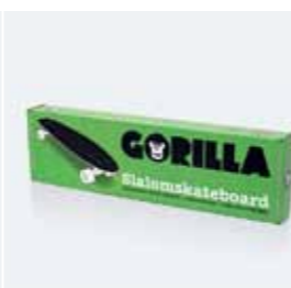
Гофрокартон с печатью